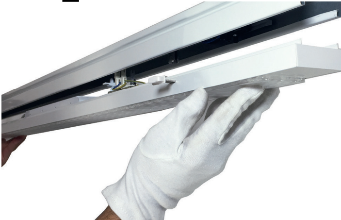
Abb. 1 Einsetzen der DIAMANT FIT Retrofitleuchte