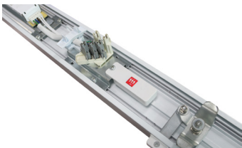
Abb. 2 Dipswitch Box für EXC bzw. PRE Treiber an der I-Select Schnittstelle.

Maße entnehmen Sie bitte der Übersichtstabelle der FIT-Systeme (Seite 2) for sizes please see the overview-table for FIT systems (page 2)