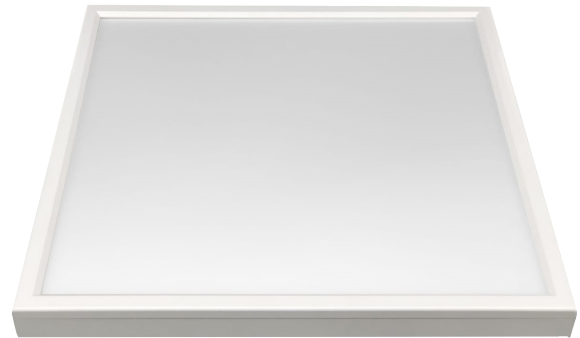
WEGA ON-TOP 620x620mm