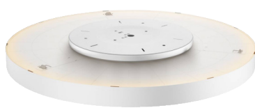
Rückansicht BOLT R inkl. Ambiente-Beleuchtung