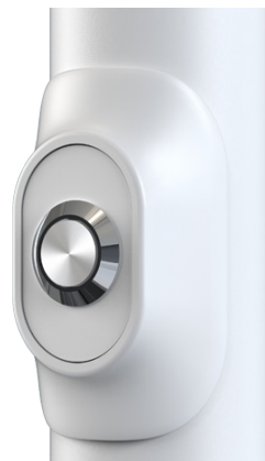
HOME SL - Bedienknopf