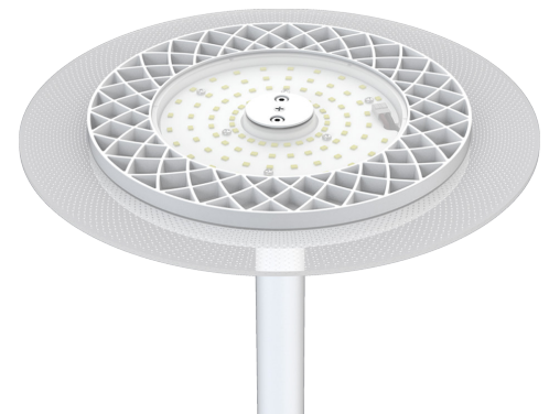
HOME SL - Leuchtenkopf