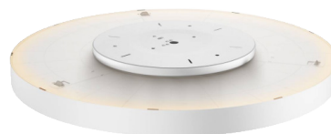
Rückansicht BOLT R inkl. Ambiente-Beleuchtung