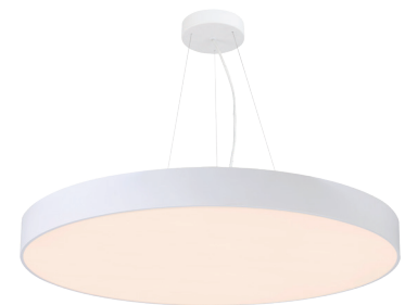
Pendelmontage BOLT R380

Bitte beachten Sie die Anforderungen der einschlägigen Normen zur Beleuchtung für die jeweilige Anwendung (z.B. Arbeitsstätten EN 12464). Die Werte wie z.B. Beleuchtungsstärke (Lux), Blendungsbegrenzung (UGR) und Gleichmäßigkeit, die Sie nicht in diesem Datenblatt finden, können Sie im Rahmen einer Lichtplanung (z.B. mit DIALux, Relux) ermitteln. Dazu benötigen Sie die von uns zur Verfügung gestellten photometrischen Daten (EULUMDAT bzw. IES). Üblicherweise stellen wir diese Dateien auf unserer Website zur Verfügung. Sollten Sie diese einmal nicht dort finden, wenden Sie sich bitte an unseren Vertriebsinnendienst.